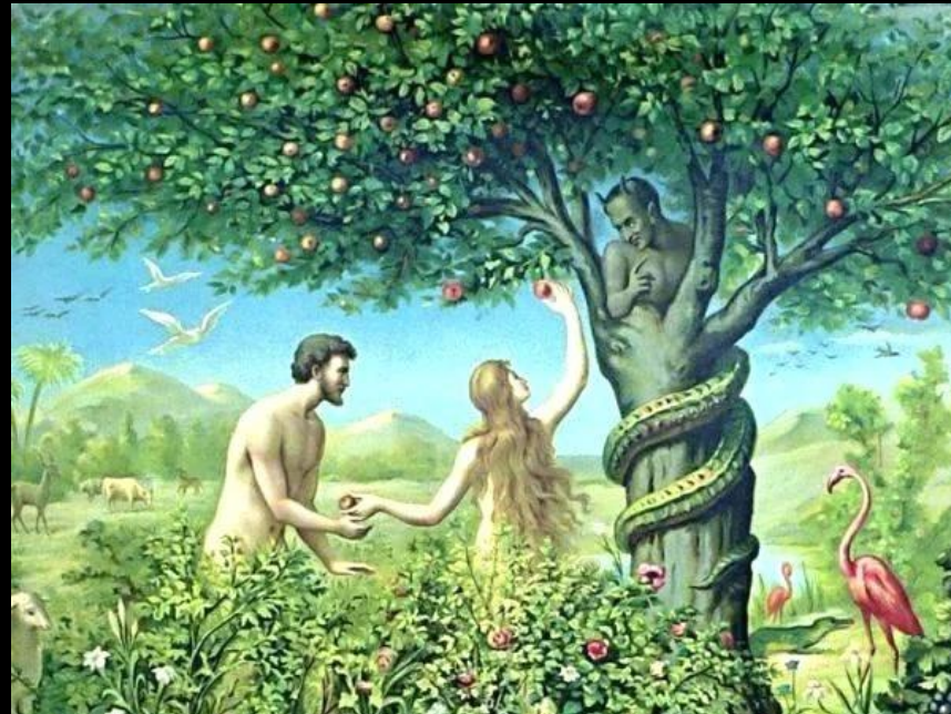
分別善惡樹代表的神的原始律法