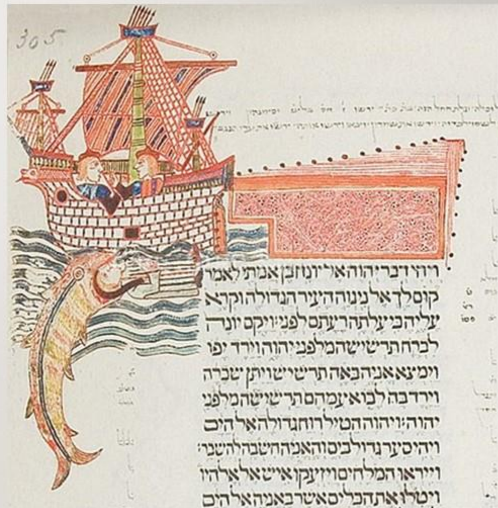
Illustration of Jonah being swallowed by the fish from the Kennicott Bible , folio 305r (1476), in the Bodleian Library , Oxford.